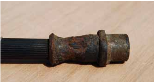
Wartel gedeeltelijk verdwenen als gevolg van corrosie.

De wartel moet daarom, zoals is genoemd in het eerste deel van artikel 5.*.31, lid 1b, beoordeeld worden op "ernstige corrosie." Hier is echter geen specifiek omschreven norm voor te geven. Het komt in zo'n geval dus aan op de deskundigheid van de keurmeester. Wel kan gesteld worden dat wanneer de wartel