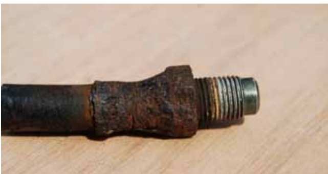
Breuk als gevolg van corrosie.

zodanig aan corrosie onderhevig is, dat een deel van de wartel is verdwenen, er van ernstige corrosie sprake is. Bijgaande foto's geven een indicatie van ernstige corrosie aan een wartel van een remslang.