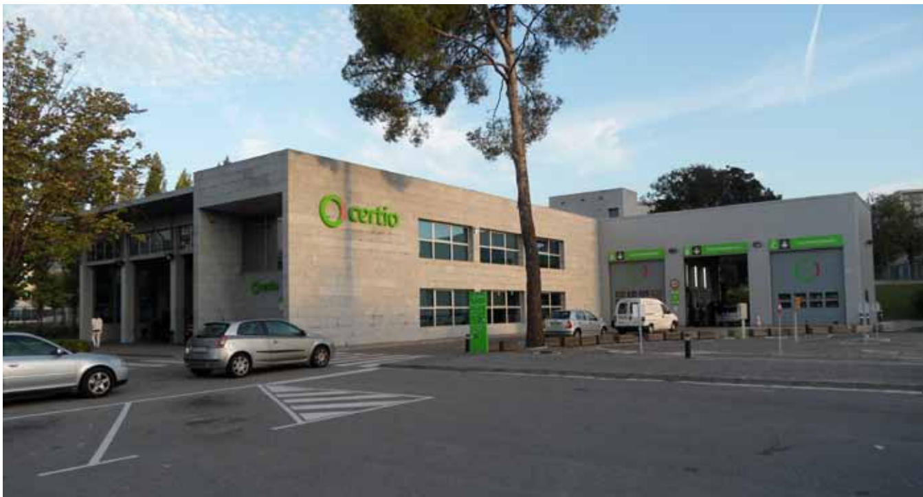
Eén van de zes APK-keuringsstations in Spanje: Certio in Barcelona