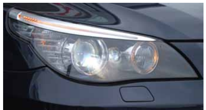
Het ambergeel zijmarkeringslicht loopt door naar de voorzijde.